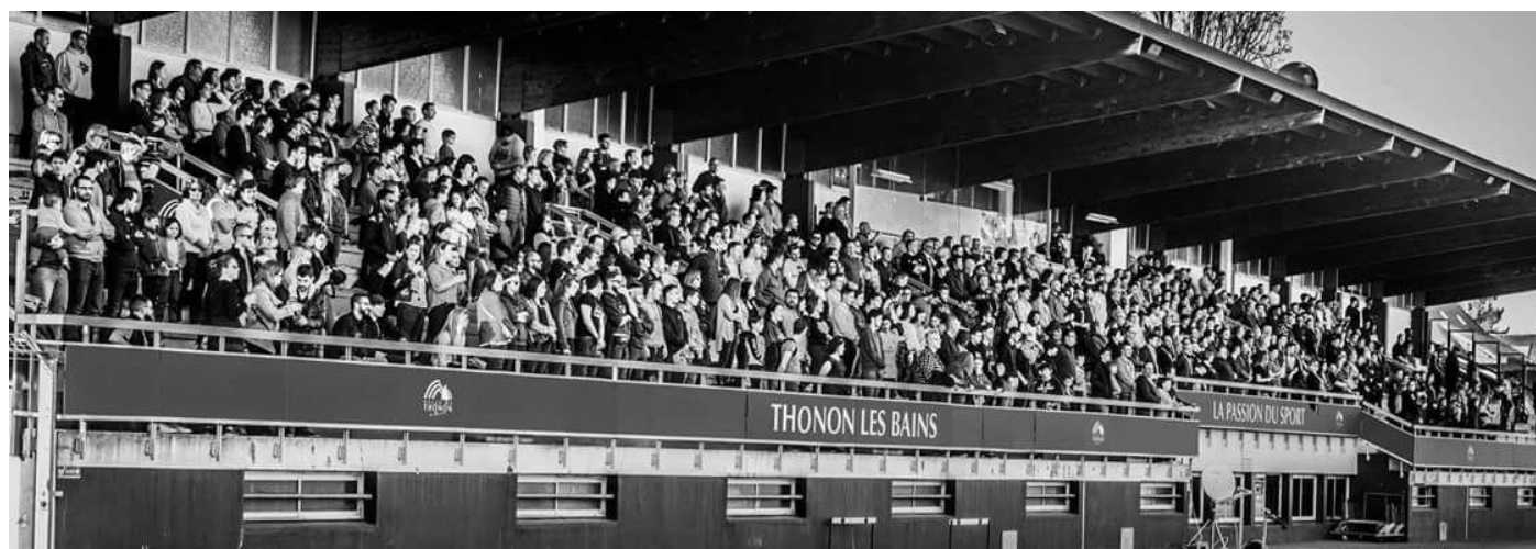
Le stade Moynat à Thonon-les-Bains